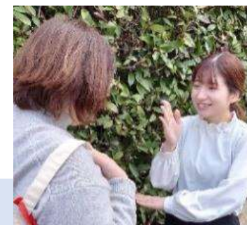
手話でのコミュニケーション