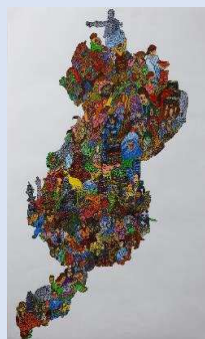
「滋賀県にあつまる」