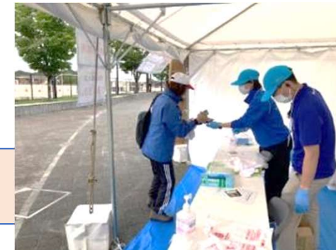
障スポリハーサル大会