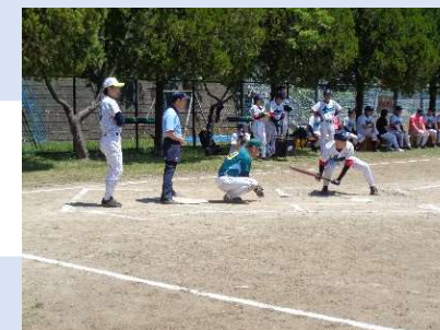
グランドソフトボール